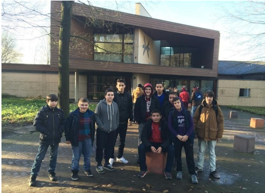
Jongeren bij kamp Westerbork